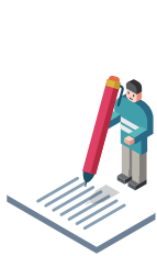
대학교 학업학기 Academic Study