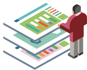
산업현장 실습학기 Work Experience